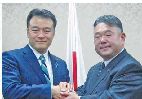
大岡敏孝 衆議院議員（環境副大臣）