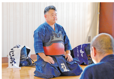
匝瑳警察署署中稽古