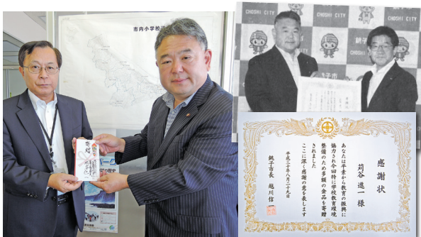
銚子市から感謝状