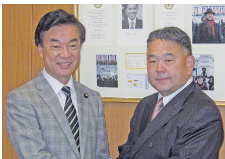
松沢成文 前参議院議員