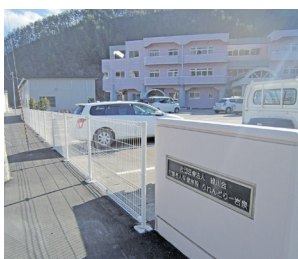
岩泉町洪水跡地現場