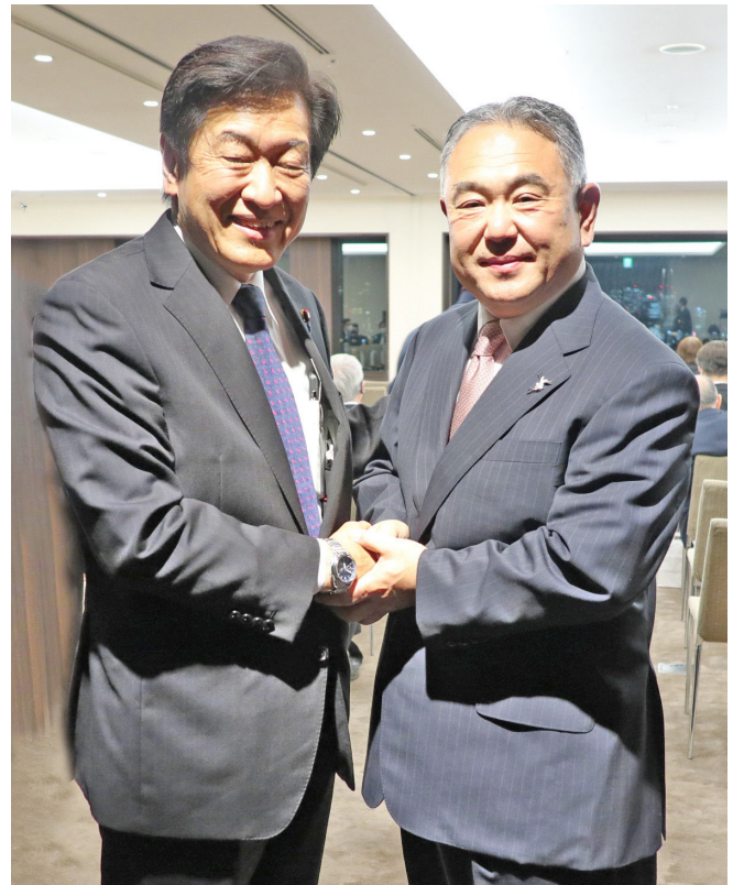
環境大臣 山口 壮議員と環境問題について会談