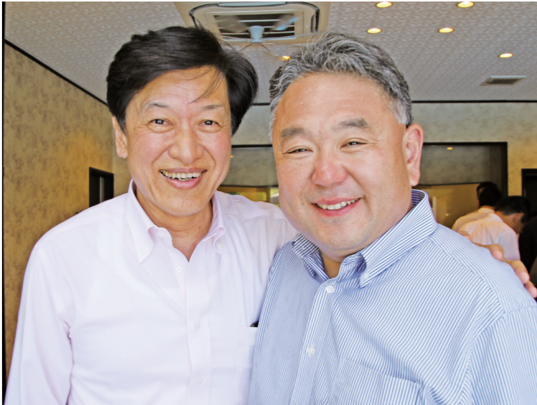
穴栗市選挙区 環境大臣 山口 壮 衆議院議員