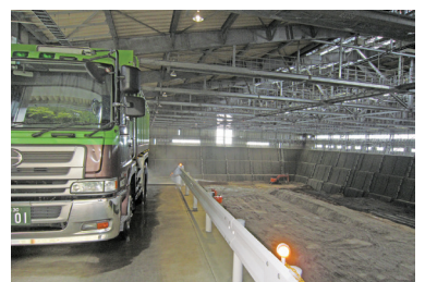
群馬県渋川最終処分場