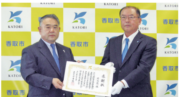
香取市から感謝状