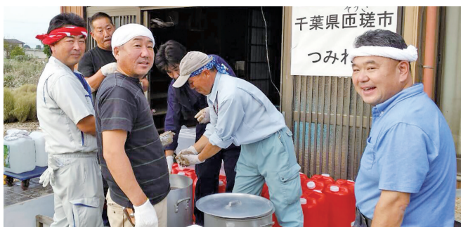
茨城県常総市鬼怒川決壊ボランティア