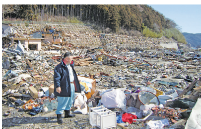
2011年3月 宮城県女川町