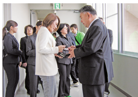
手話の会耳の日まつり 今井絵理子 参議院議員