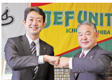
県民の命とくらしを守る 熊谷千葉市長と面談（現千葉県知事）