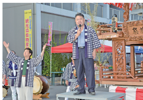
八重垣神社祇園祭