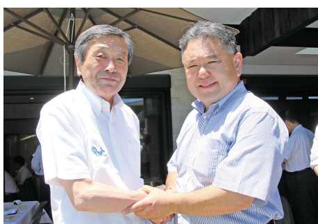
林自民党 地方創生実行統合本部長