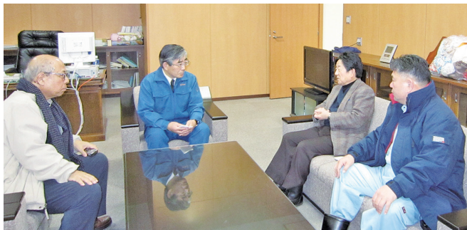
2011年3月 石巻市長へ救援物資届ける