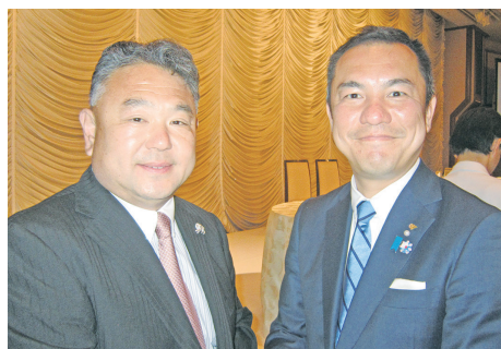
鈴木英敬衆議院議員（前三重県知事）