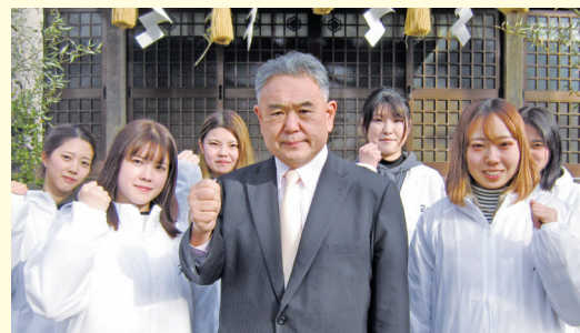
新型コロナウイルスの収束祈願 市民の若者たちと（八重垣神社にて）