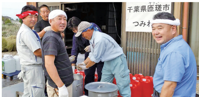
茨城県常総市鬼怒川決壊ボランティア