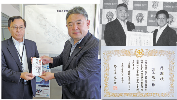
鉾子市から感謝状