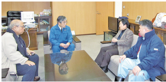
2011年3月 石巻市長へ救援物資届ける