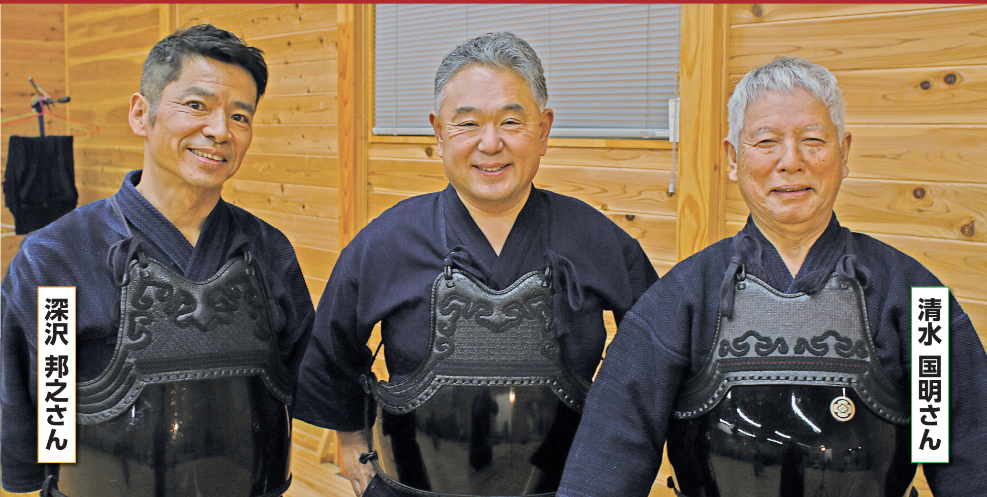
回天道場 稽古会にて