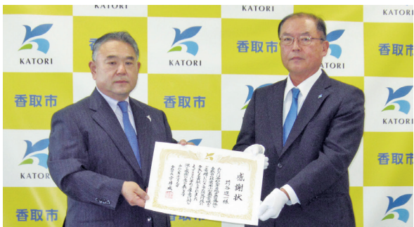
香取市から感謝状